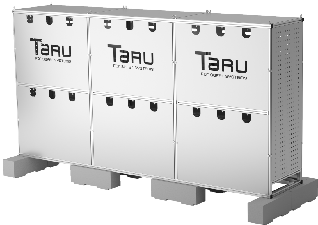
Wechselrichterunterstand XL Basis + zwei Erweiterungen auf Betonsockel Inverter Shelter XL Basic + two Extensions on Concrete Blocks